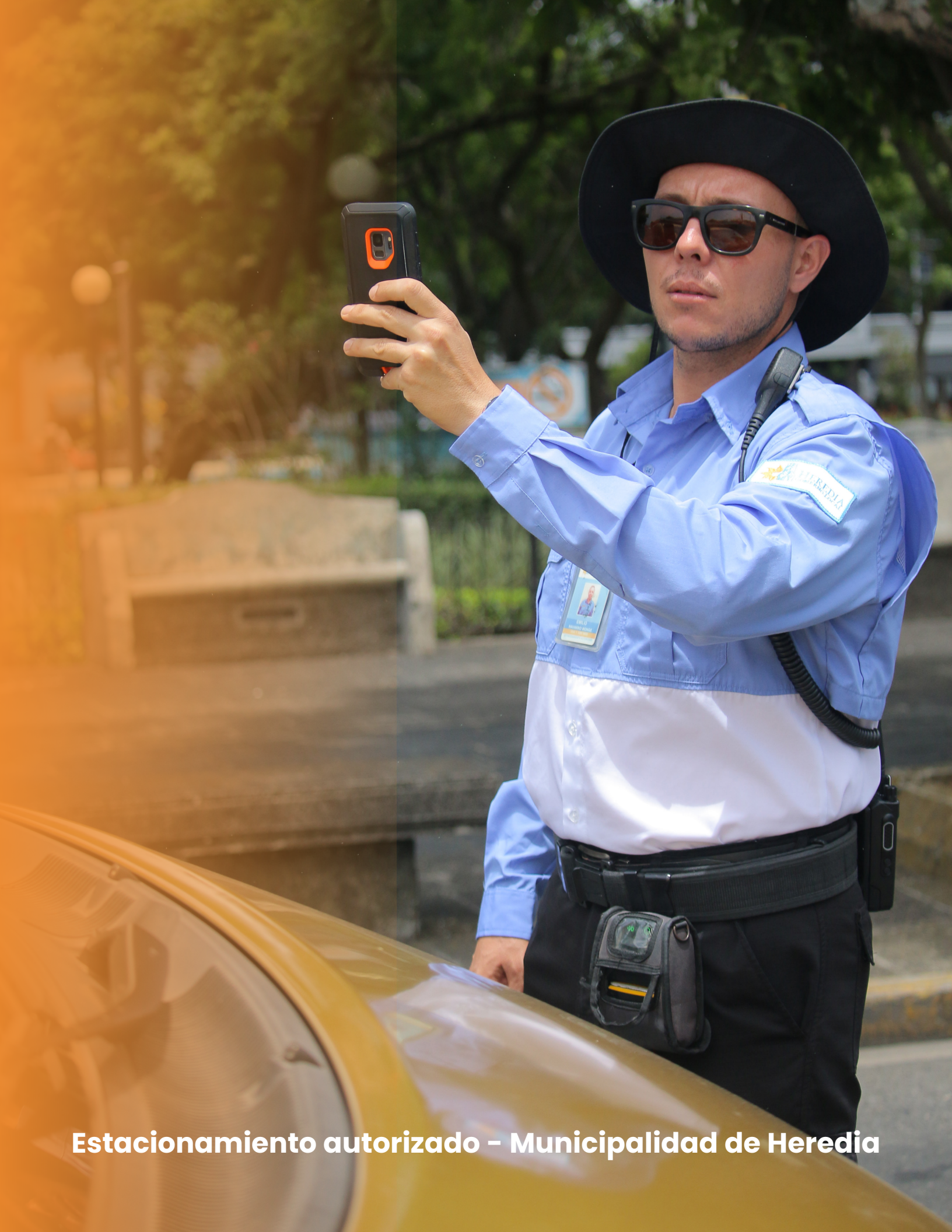
Estacionamiento autorizado – Municipalidad de Heredia