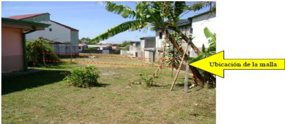
Foto No.5. Área donde se colocaría la malla.

El resto del inmueble se habilitaría para área de parque que sería para el disfrute de toda la comunidad. Con esta propuesta se preservaría el Centro Diurno y, además, los vecinos podrían disponer del parque con varios accesos.