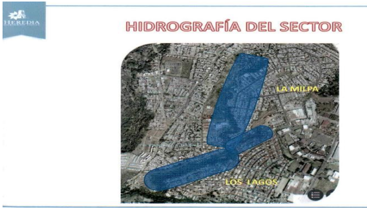
IMAGEN DE UBICACIÓN